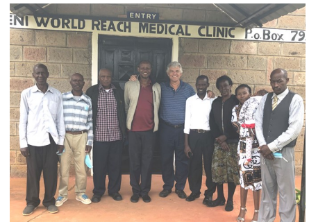
En la clínica de Muthethini en Dic.