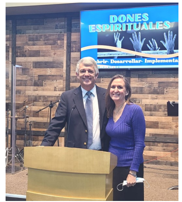
En "Briarwood en español"

World Reach, P.O. Box 26155, Birmingham, AL 35260