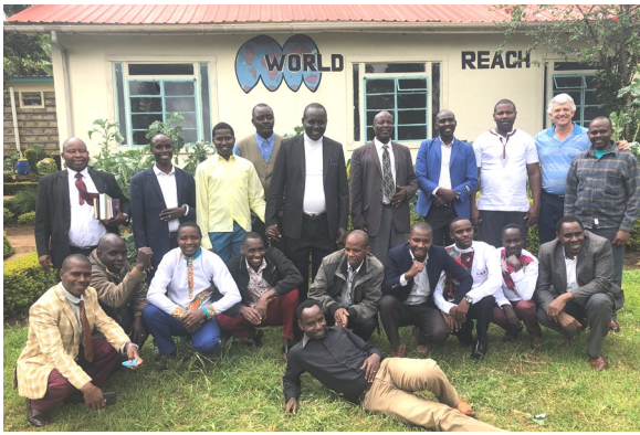
Pastores de Kenia en mi clase en Meru